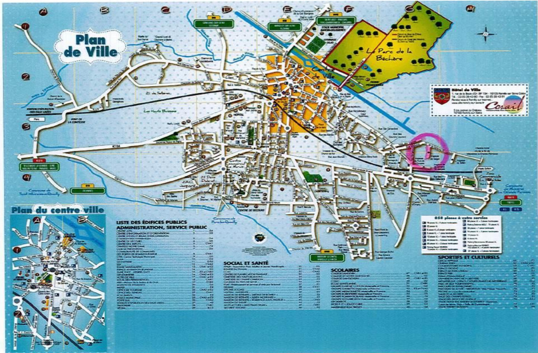
5 – Plan de situation.