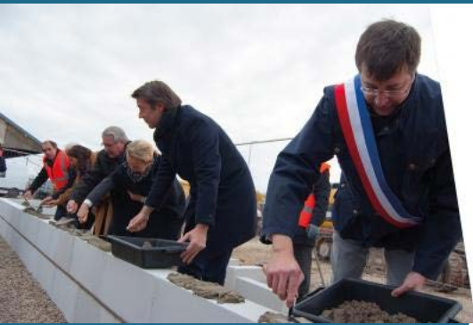
Pose de la première pierre du poste de signalisation de Romilly-sur-Seine